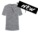
672 EBONY CHINÉ